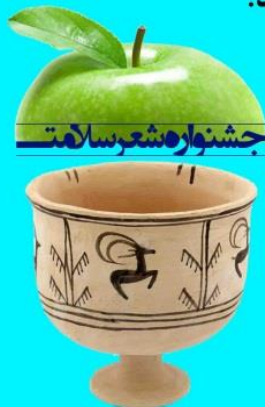
جشنواره شعر سلامت

بر اساس رای هیات داوران به نفرات اول تا هفتم تندیس جشنواره + لوح افتخار + جایزه نفیس اهدا خواهد شد.